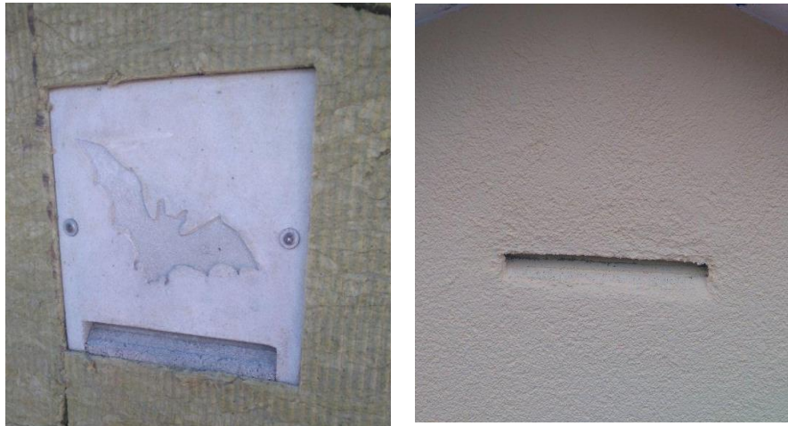
Ffigur A2-2: Enghraifft o flwch ystumod sy'n rhan o fesur lliniaru/gwelliant