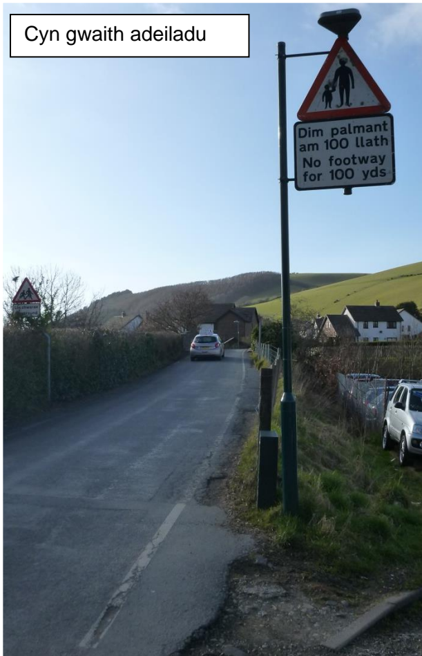
Cyn gwaith adeiladu

Yn 2016-17 gweithredwyd ar 'Gam 2' y cynllun ac adeiladwyd troedffordd newydd ger y bont a oedd yn arwain i Stad Brynecastell.