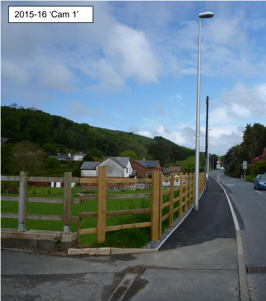
2015-16 'Cam 1'