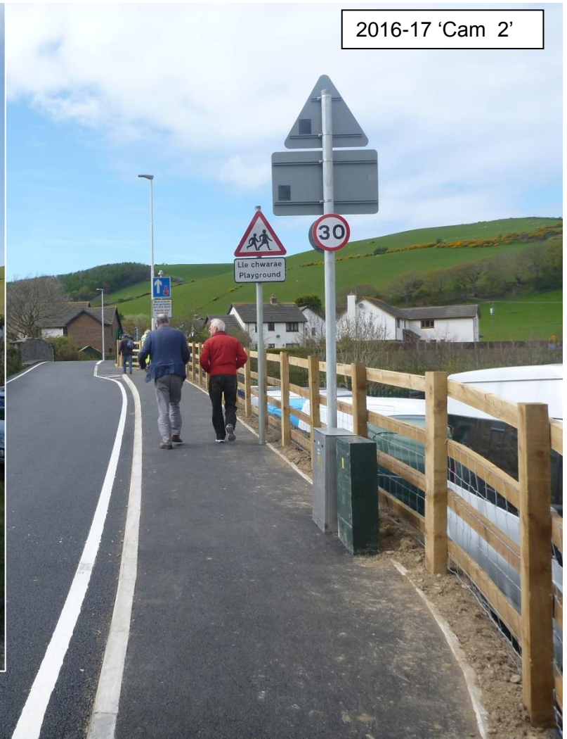
2016-17 'Cam 2'