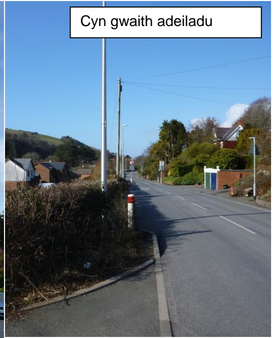
Cyn gwaith adeiladu