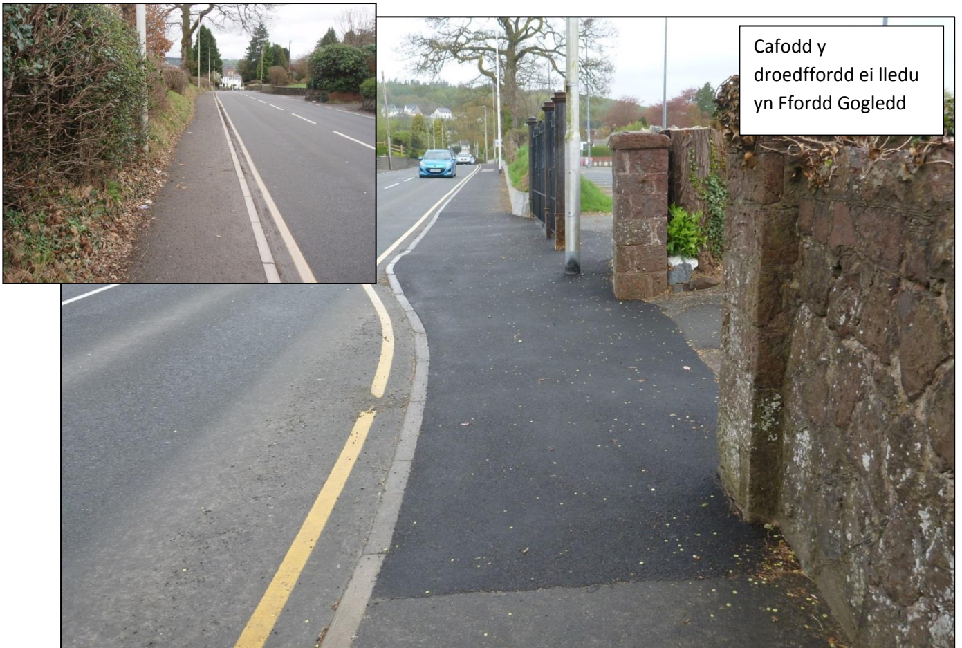
Cafodd y droedffordd ei lledu yn Ffordd Gogledd