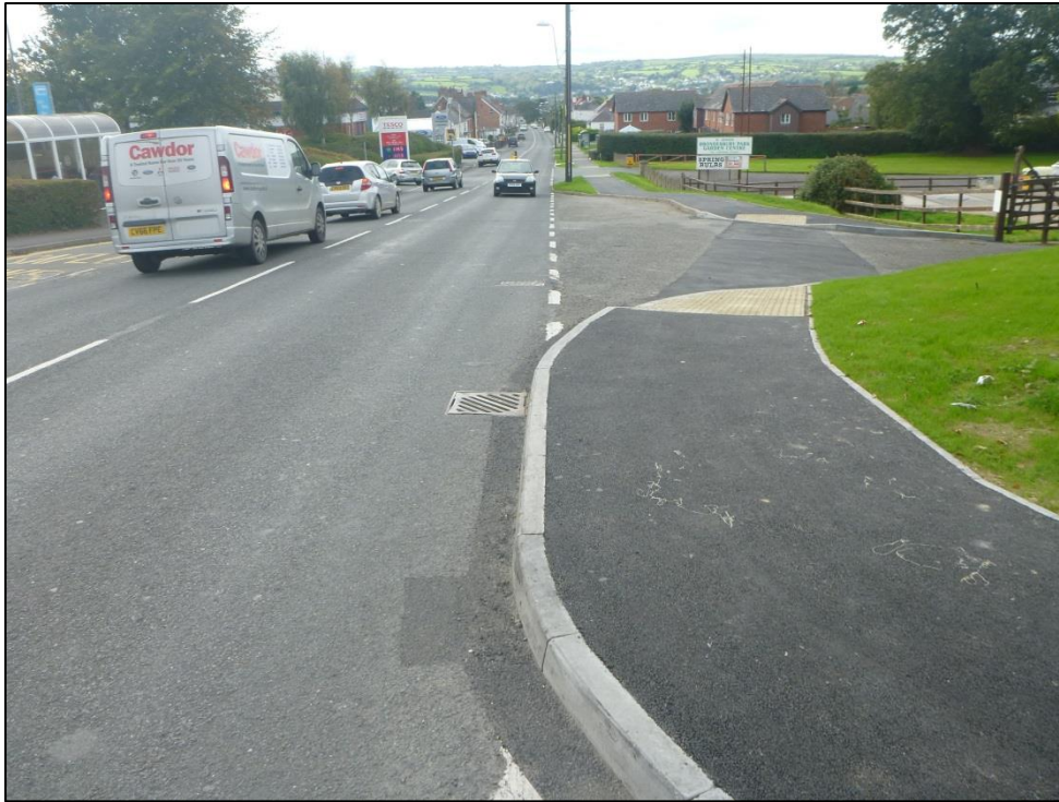
Chwith: Gosodwyd cyswllt troedffordd newydd.

Roedd y gwaith yn Aberteifi hefyd yn cynnwys lledu'r droedffordd ar Ffordd Pont y Cleifion yn dilyn grant ychwanegol o £47,000 oddi wrth Lywodraeth Cymru yn dilyn cwblhau'r gwaith uchod yn gynnar, a thrwy hynny cynyddu cyfanswm gwerth y pecyn ar gyfer Aberteifi i £162,000. Bu i'r arian yma ein galluogi i osod cyrbau isel a darparu gwell cyswllt ar gyfer cadeiriau gwthio a defnyddwyr peiriannau symudedd ar y trywydd yma rhwng Canol y Dref a Pharc Busnes Teifi.