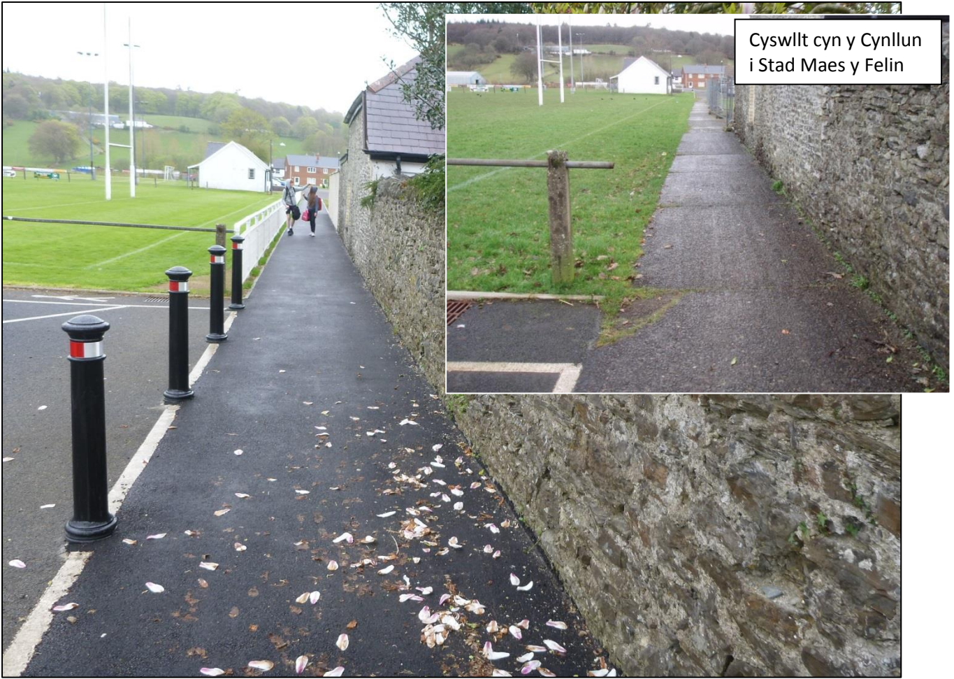
Cyswllt cyn y Cynllun i Stad Maes y Felin