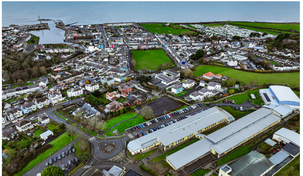
Adeiladu Morglawdd Pier y Gogledd

Mae BAM yn gweithio mewn partneriaeth â Chyngor Sir Ceredigion ac AtkinsRéalis Design Consultancy i gyflawni Cynllun Amddiffyn Arfordir Aberaeron.