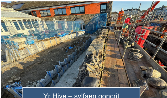
Yr Hive – sylfaen goncrit