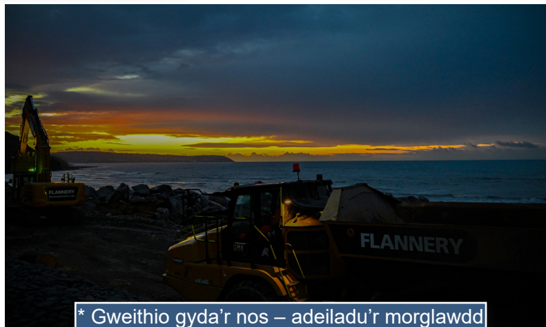
* Gweithio gyda'r nos – adeiladu'r morglawdd yn ystod llanw isel ar hyd Traeth y De