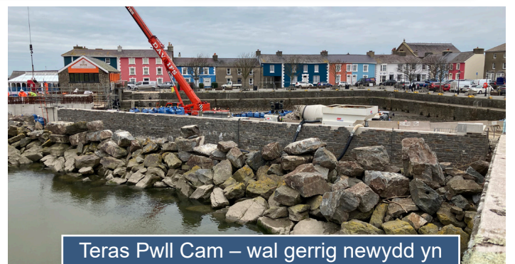
Teras Pwll Cam – wal gerrig newydd yn barod ar gyfer y paneli gwydr