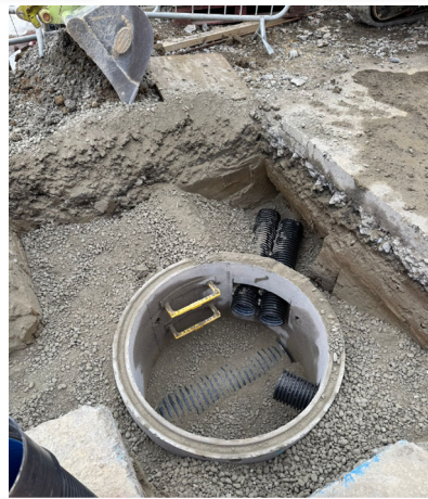
Pen Cei – gosod tyllau caead draenio newydd