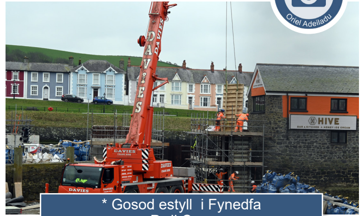
* Gosod estyll i Fynedfa Pwll Cam