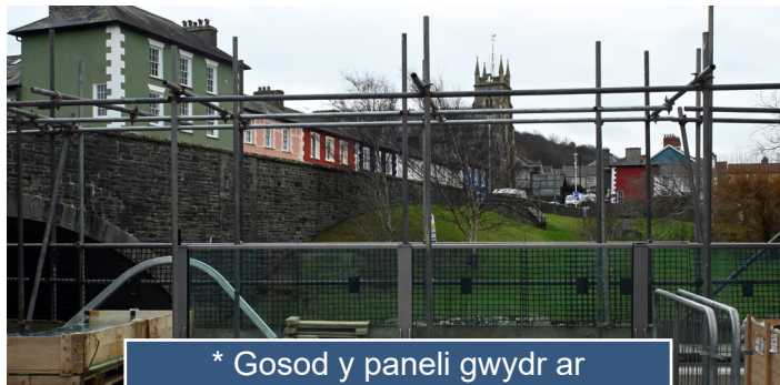
* Gosod y paneli gwydr ar hyd afon Aeron