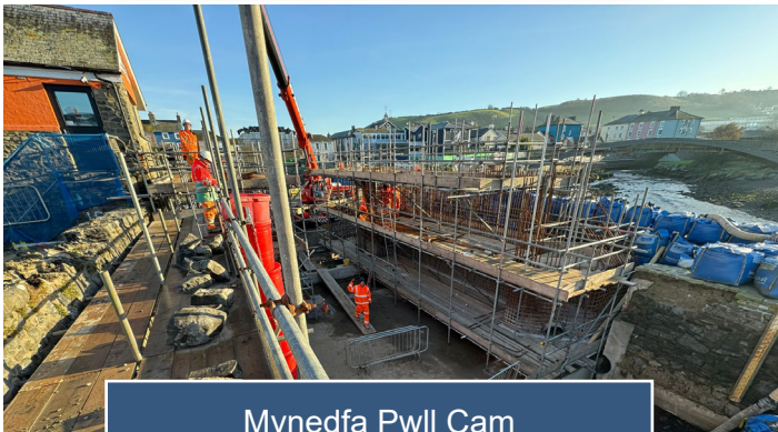
Mynedfa Pwll Cam