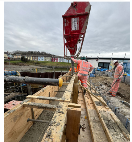
Arlwys concrit trwy graen i gryfhau wal ardd gefn yr Hive