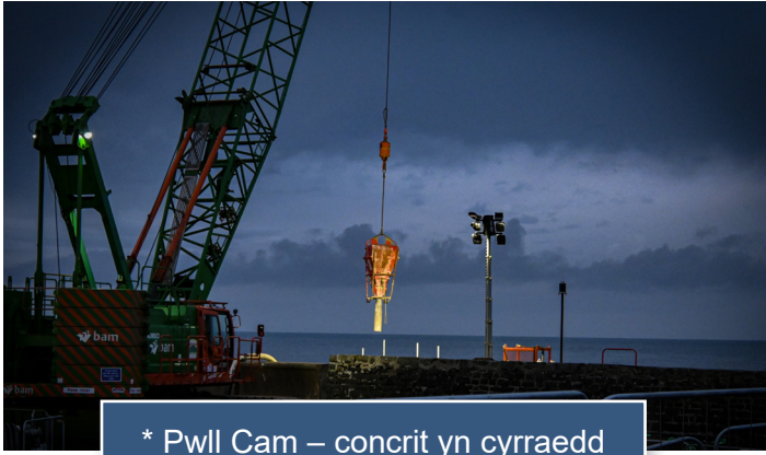
* Pwll Cam – concrit yn cyrraedd