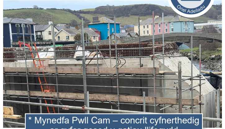
* Mynedfa Pwll Cam – concrit cyfnerthedig ar gyfer gosod y gatau llifogydd