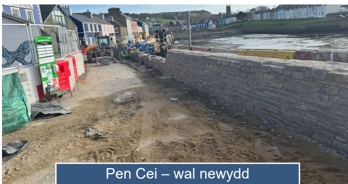
Pen Cei – wal newydd â chladin cerrig