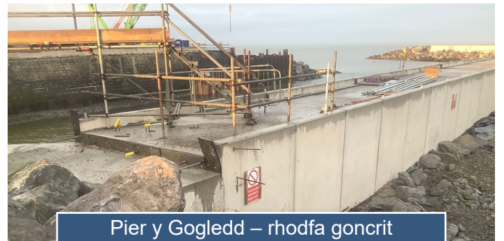
Pier y Gogledd – rhodfa concrit newydd ar hyd y morglawdd