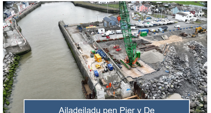
Ailadeiladu pen Pier y De