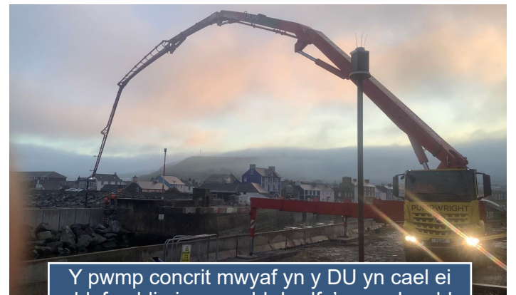
Y pwmp concrit mwyaf yn y DU yn cael ei ddefnyddio i gyrraedd rhodfa'r morglawdd