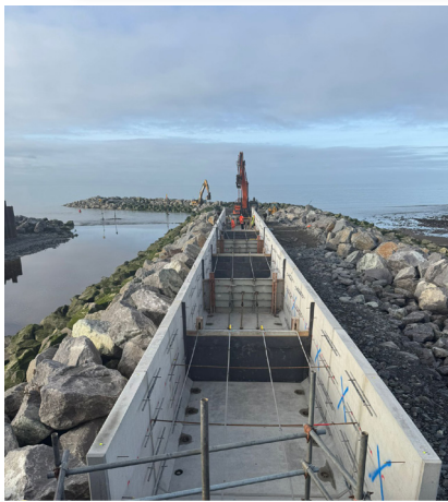
Gosod yr unedau wedi'u rhag-gastio ar hyd y morglawdd