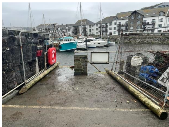
Ar ôl clirio

Gwnaeth y Gwasanaeth Harbyrau hefyd glirio chwyn, dail a malurion o gwmpas yr harbwr. Bydd y Gwasanaeth Harbyrau yn cymryd camau i fynd i'r afael â baw cŵn yn Harbwr Aberystwyth. Bydd paent chwistrell a stensiliau'n cael eu defnyddio mewn lleoliadau allweddol cyn tymor yr haf.