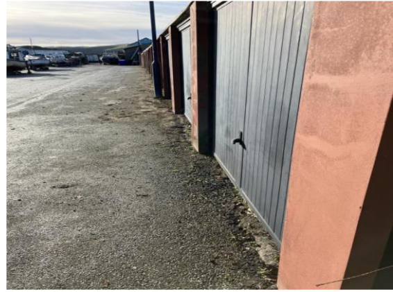
Ar ôl clirio

Mae craciau ar y pier yn Harbwr Cei Newydd wedi'u llenwi ac rydym yn edrych i barhau â'r gwaith hwn i'r Gwanwyn.