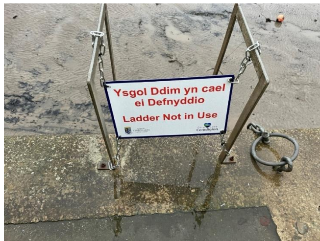
Esiamp! o arwydd sydd wedi'i osod yn Harbwr Aberaeron.

Yn dilyn archwiliadaudiweddar, nodwyd bod sawl ysgol yn harbyrau Aberystwyth ac Aberaeron angen eu hatgyweirio. Mewn rhai achosion, bu'n rhaid atal mynediad at ysgolion ac mae arwyddion wedi'u gosod i ddangos pa rai nad ydynt i'w defnyddio. Rydym ar hyn o bryd yn cynnal ymarfer caffael i ymgysylltu â chontract i ymgymryd â'r atgyweiriadau gofynnol gyda'r bwriad o ailagor yr holl ysgolion hyn yr effeithir arnynt cyn gynted â phosibl.