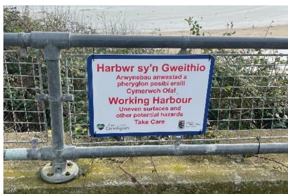
Enghraifft o ddefnydd arwydd yng Ngheï Newydd.

Rydym erbyn hyn yn ymgysylltu â chontractwyr i osod arwyddion o rybudd i aelodau'r cyhoedd a defnyddwyr yr harbyrau o'r risgiau sydd ynghlwm wrth cael mynediad at harbyrau sy'n gweithio. Mae'r gwaith osod yr arwyddion hyn wedi dechrau a bydd y gwaith hwn yn parhau i mewn i'r gwanwyn.