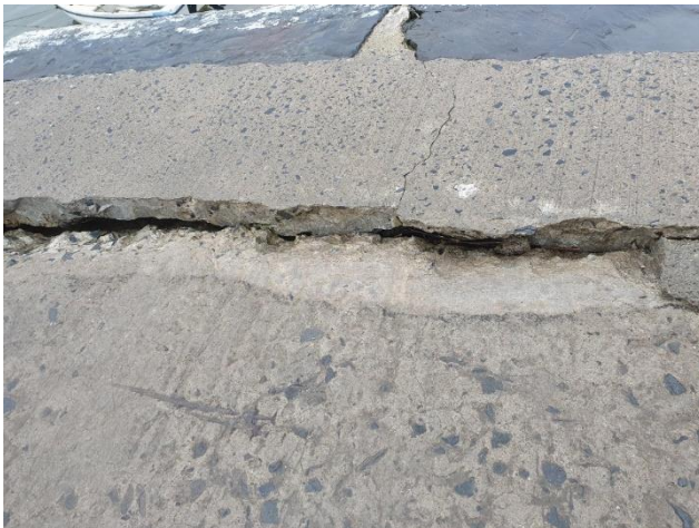
Cyn y gwaith

Mae craciau ar y pier yn Harbwr Cei Newydd wedi'u llenwi ac rydym yn edrych i barhau â'r gwaith hwn i'r Gwanwyn.