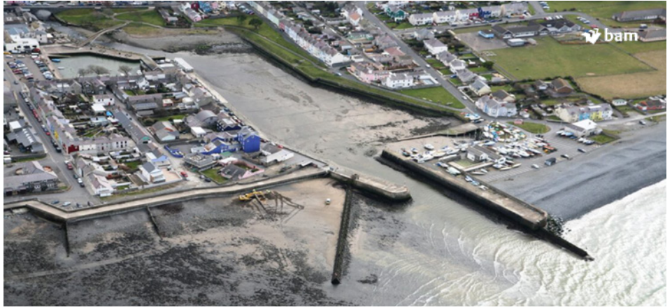
Bydd BAM Nuttall yn gweithio mewn partneriaeth â Chyngor Sir Ceredigion ac AtkinsRéalis Design Consultancy i ddarparu Cynllun Amddiffyn Arfordir Aberaeron.

Dyma ein cylchlythyr cyntaf ar gyfer Cynllun Amddiffyn Arfordir Aberaeron sydd ar y gweill, er mwyn cyflwyno BAM Nuttall Limited, y prosiect a throsolwg o'r gwaith sydd ar ddod.