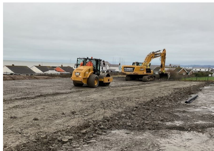
Paratoi daear y safle