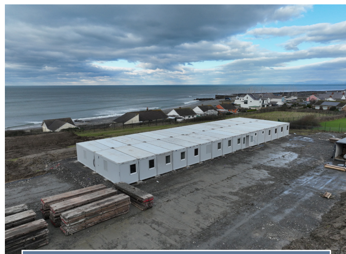
Gosod swyddfa dros dro ym Mhenmorfa