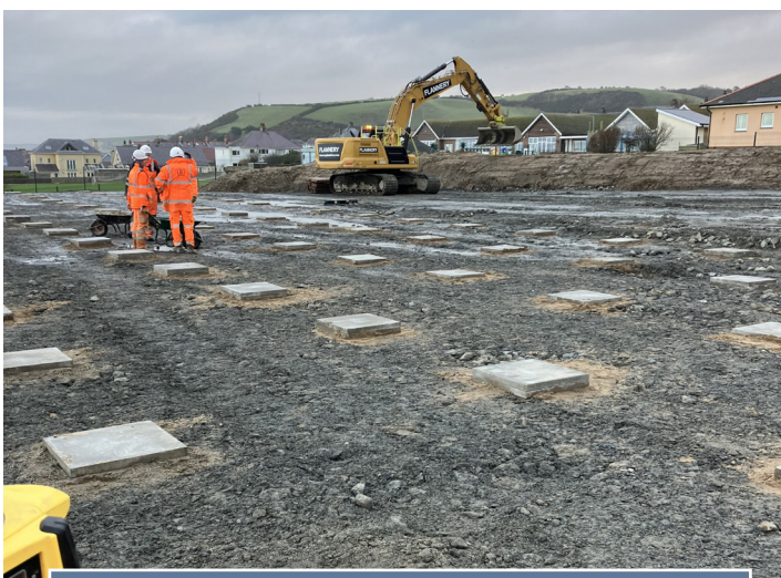
Paratoi sylfeini'r swyddfa dros dro