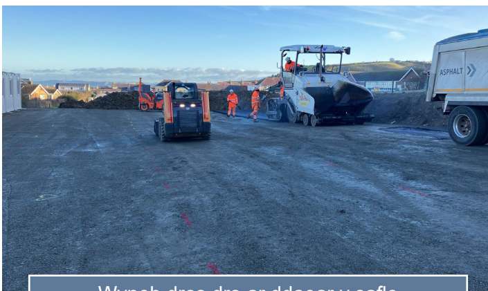
Wyneb dros dro ar ddaear y safle