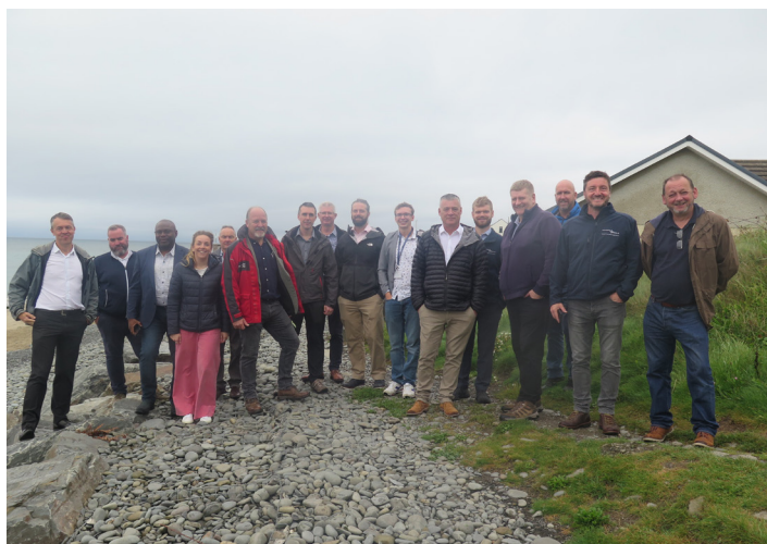
Ymweliad cyn cychwyn ar gyfer ein Tîm Cyflenwi